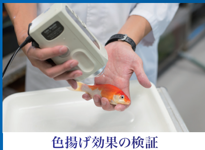
色揚げ効果の検証