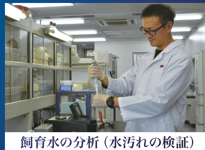
飼育水の分析(水汚れの検証)