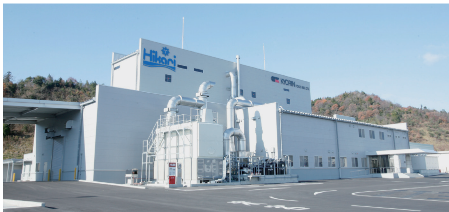
2007年 最新設備を導入した福崎工場を新設(第4工場)