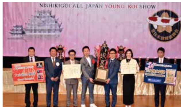
第41回錦鯉全国若鯉品評会 表彰式