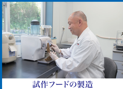
試作フードの製造

2001年に設立。経験則で語られる事が多かったアクアリウムの世界を科学的に検証し、これまで世界になかった商品を生み出します。